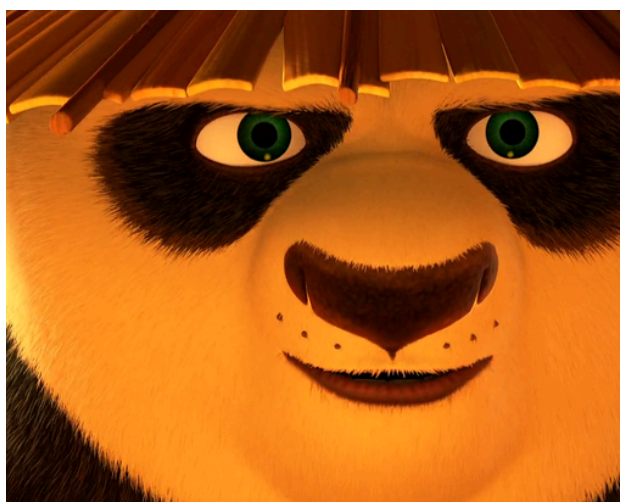
e - _____