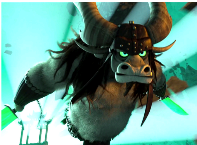
a - _____

PO – OOGWAY – SEÑOR PING – KAI – TIGRESA – LI SHAN