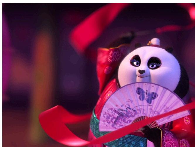
c - _____