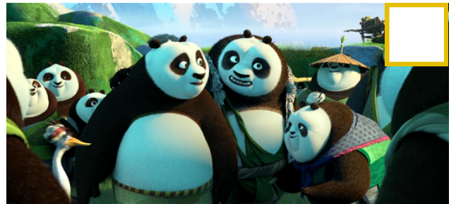
Figura 2 - En el valle de los pandas