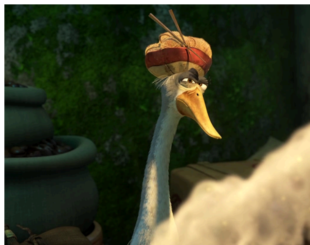
b - _____