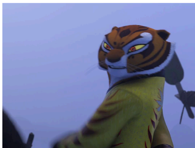
f - _____