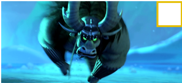
Figura 3 - Kai atacando el valle