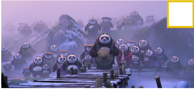
Figura 1 - Descubrirse a sí mismo