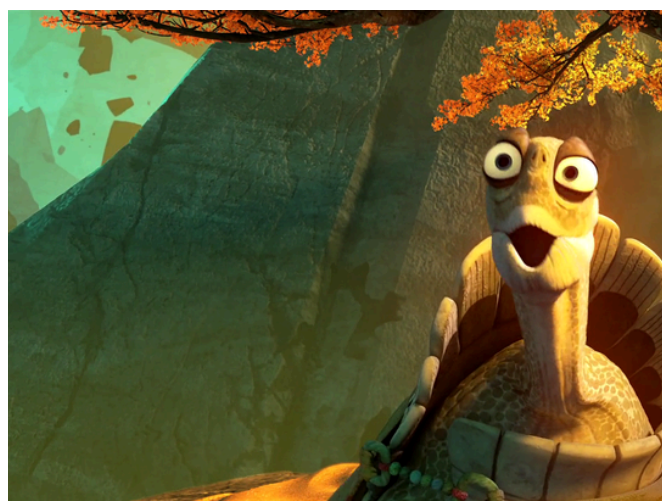
d - _____