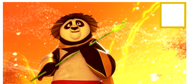
Figure 6 - Le Guerrier Dragon