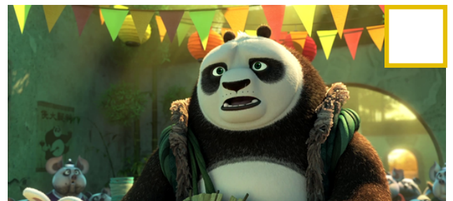
Figure 4 - Se retrouver